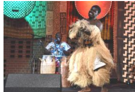
LIVE PERFORMANCE ライブ・パフォーマンス