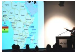
AFRICAN DAY アフリカン・デー