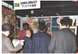
EMBASSY AREA 大使館コーナー